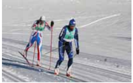
I due presidenti in pista

Ad Agosto è stata ospitata in Valle per il terzo anno consecutivo la Nazionale di Sci Nordico.