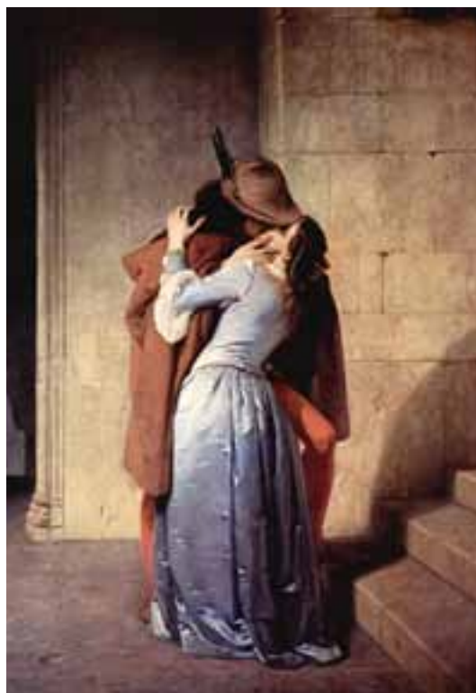
Il "Bacio" di Francesco Hayez - 1859

apprezzato filone di derivazione storico-letteraria della produzione del pittore, che alla metà del XIX secolo già aveva annoverato tante invenzioni figurative efficacissime, alcune delle quali ispirate per l'appunto da Maffei" (Susanna Zatti).