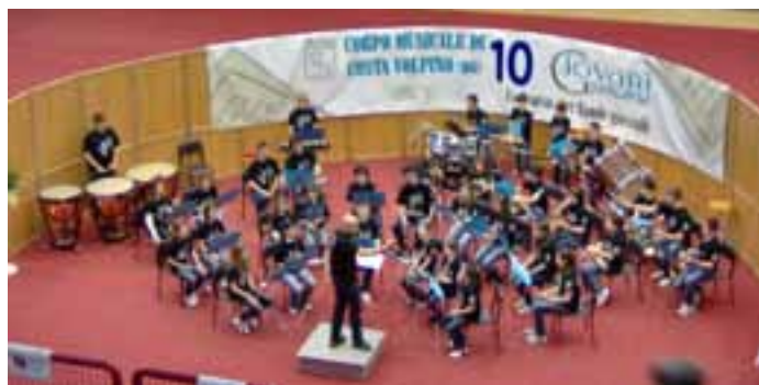
La Bandina ledrense durante l'esecuzione a Costa Volpino