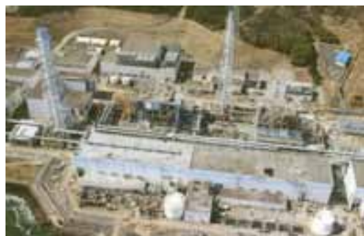
La centrale di Fukushima