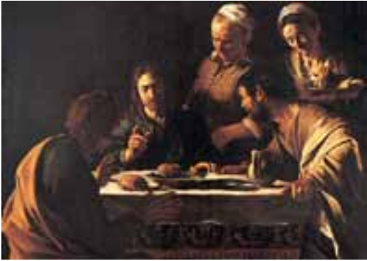
Cena in Emmaus - Caravaggio

È di nuovo lui con un gesto simbolico che si fa riconoscere.