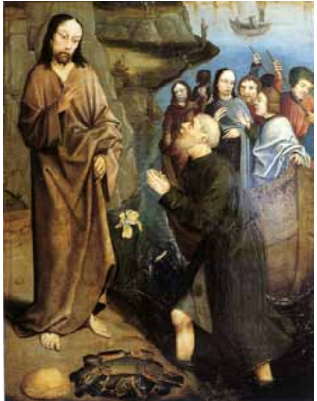
La pesca miracolosa - Anonimo XVI secolo