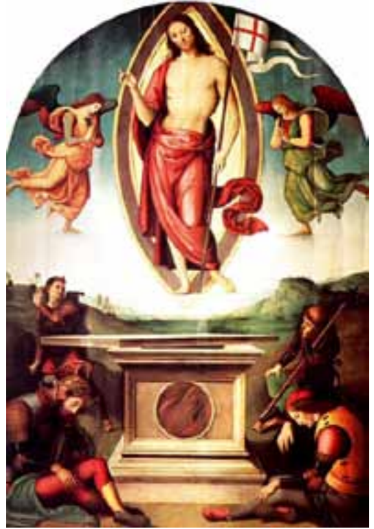
Cristo Risorto - Pietro Cristoforo Vannucci detto il Perugino - Palazzo Apostolico

Come cambiare prospettiva, come risorgere da questa tristezza che sempre ci rabbuia. Proviamo a parlare e non a chiacchierare. Con il vicino di casa delle nostre cose intime, i nostri sogni. Cantiamo una canzone. Proviamo l'ebbrezza del silenzio, senza lasciarci schiacciare dalla TV o dalle radio sempre accese. Raccontiamoci storie vere, le nostre. E quelle positive, che ci fanno crescere. Evidenziamo la storia di quella anziana che vive di fede, dell'aiuto reciproco che si danno quelle famiglie, della fatica di due sposi per tener unita la famiglia, del volontariato che accresce i rapporti, della sofferenza condivisa. Sappiamo tutto dei pettegolezzi di