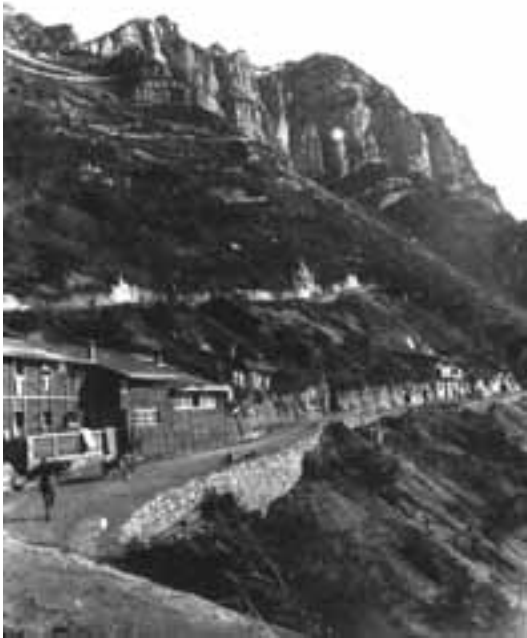
Baracche alla Bocca dei Fortini, 1917

L'acque han riflessi di luci azzurre, di luci bionde, di strane luci cristalline dove iridescente e lieto qualche raggio di sole scherzando s'infrange. Passano trepide farfalle variopinte con ali di velluto, fiori vaganti nella gaia luce. Tra l'erbe ovunque sbocciano, germogliano, si schiudono, pel tepore dell'aria, i mughetti, i narcisi; odorano le viole lungo i verzieri, ridono i papaveri rossi in riva al lago. Pullulano acque limpide nel vivo sasso dove prima v'era la neve e il ghiaccio e dove il sole a stento penetrava in dicembre. Passan nell'aria effluvii, odor di stame,