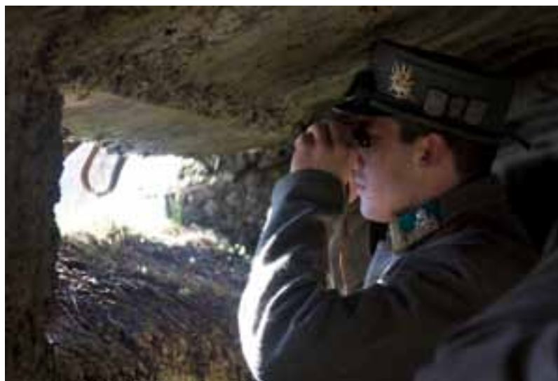
Immagine tratta dal filmato di Dario Colombo