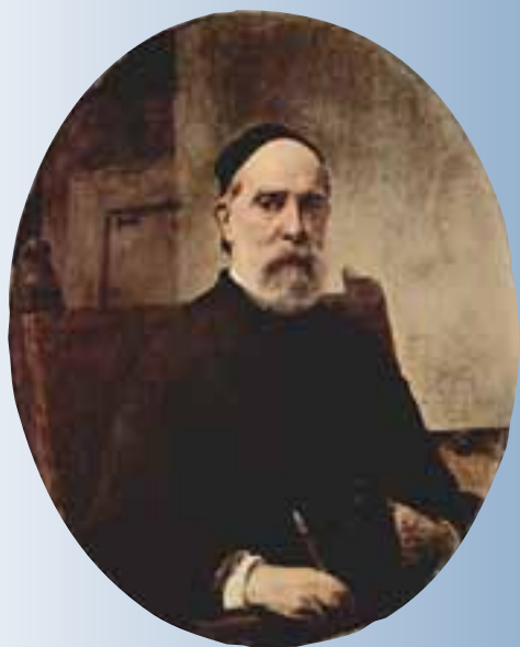
Autoritratto di Francesco Hayez a 88 anni

Nacque a Venezia nel 1791, morì a Milano il 21 dicembre 1882 all'età di novantuno anni. Allievo di Canova, operò a Roma, a Napoli e a Milano dove venne a contatto con la borghesia liberale della città, frequentando il salotto Maffei. È considerato il pittore italiano massimo esponente del Risorgimento; i suoi dipinti furono un mezzo per diffondere nell'animo degli Italiani una comune coscienza nazionale. Su di lui scrisse un saggio anche Giuseppe Mazzini. Tra le sue opere numerosissimi ritratti, tra cui quelli famosi di Alessandro Manzoni e di Camillo Benso conte di Cavour.