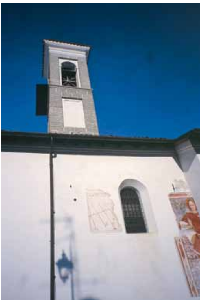
Campanile di Mezzolago