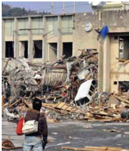
La desolazione dopo il terremoto e lo tsunami

Ho il ricordo di molte notti passate nella paura, da bambina, quando al tremare della casa mi coprivo più forte con le coperte. Fin da piccoli cominciamo ad esercitarci per l'emergenza del terremoto. Ancora dalla scuola materna si fanno due esercitazioni all'anno e poi si prosegue sempre, sia nelle scuole che negli ambienti di lavoro.