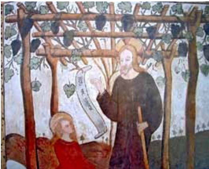
Noli me tangere - Evaristo Bascheni

"sessanta stadi", sette miglia nella traduzione moderna; Gesù si fece loro compagno di viaggio, "ma i loro occhi erano incapaci di riconoscerlo"; e tra loro, lungo il viaggio parlarono di tutto, di quello che era accaduto, della passione, della morte, delle speranze distrutte, delle profezie, anche dell'incontro con lui da parte di "alcune donne, delle nostre" e di quanto gli angeli avevano detto loro; "Speravamo noi...". Anch'essi non lo avevano riconosciuto perché troppo immersi nei loro dubbi, nelle loro delusioni, nelle speranze crollate. Poi, a cena, lui "spezzò il pane e lo diede loro", e "si aprirono i loro occhi e lo riconobbero".