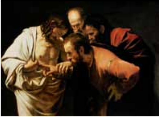
L'incredulità di Tommaso - Caravaggio

la risurrezione, nonostante la testimonianza dei discepoli e delle donne; ed anche per lui il Cristo ha creato l'occasione per fargli trovare la fede: "Metti qui il tuo dito... stendi la tua mano...".