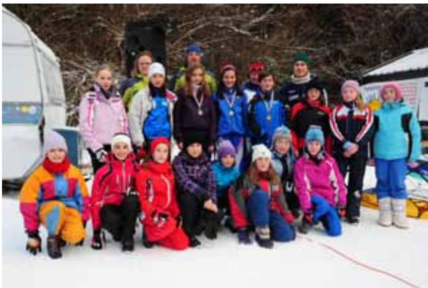
Il gruppo dei bambini che ha seguito il corso

A fine Novembre comincia la vera stagione invernale. Anche quest'anno, come ormai da tempo, collaboriamo con l'Istituto Comprensivo di Valle, organizzando corsi di sci per le elementari di Concei quali attività facoltative. Il desiderio è quello di allargare anche alle altre scuole, ma per il momento