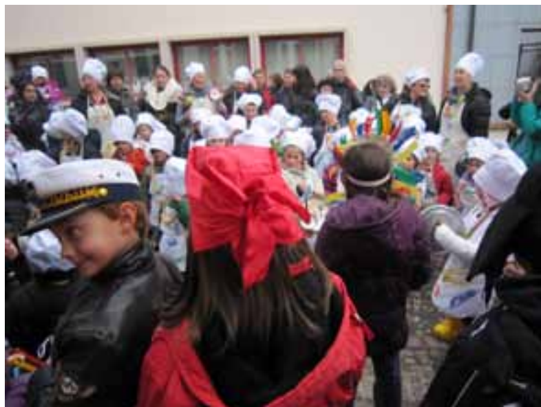
Sfilata del carnevale 2011 sul tema “tutti cuochi”

Che si intende per amore viscerale, sentimentale, intelligente? Questa triplice definizione e distinzione è stata accennata al termine della serata ma è stata meglio sviluppata nell’incontro già svolto il 1° aprile 2011.