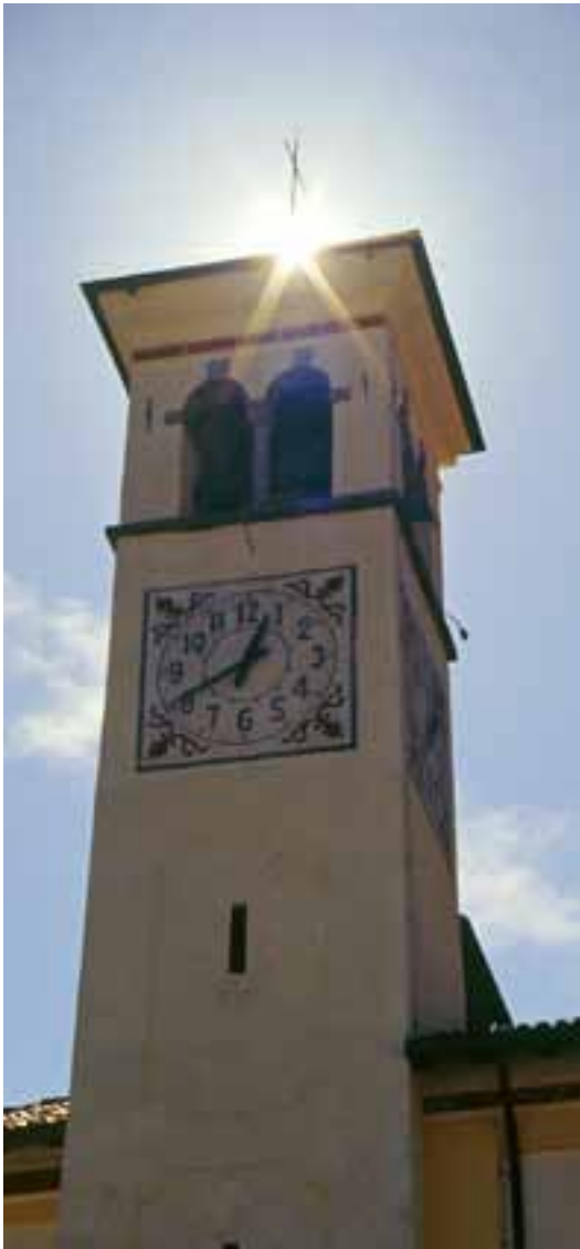
Campanile di Lenzumo

In Valle c'è l'Unità Pastorale riconosciuta dal 2004, ma il Diritto canonico riconosce solo le Parrocchie. Pertanto sul piano ecclesiale abbiamo un solo Consiglio Pastorale, ma sul piano giuridico abbiamo ancora 8 Parrocchie con i rispettivi CPAE.