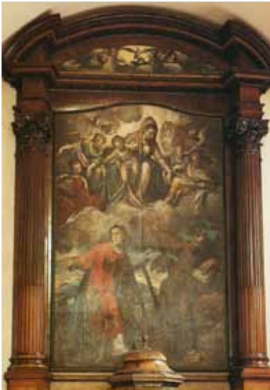
Maria Santissima tra angeli, S. Francesco e S. Lorenzo - Pala dell'altare della chiesa - Convento dei Cappuccini di Arco - Paolo Farinati

Molti hanno sperimentato la bellezza di una serata in convento, sì, quello dove abitano padre Massimo, padre Paolo, padre Fabrizio, che spesso incontriamo nelle Messe festive delle nostre comunità. Il convento era nei secoli passati un centro di vita spirituale e culturale, dove persone sperimentavano la vita da fratelli, per questo chiamati "frati".