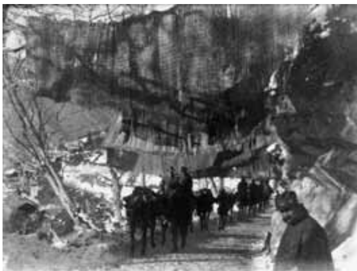
Passaggio di truppe italiane lungo la mulattiera per monte Carone

piovono perle, lacrime, gocciole, petali bianchi, petali rosa. Tutto s’infiora, tutto s’infoglia, sotto il ridente cielo, per cui spande fra i raggi del sole un pulviscolo d’oro