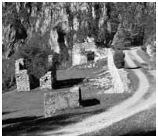
Passo Nota - I resti dell'ospedale militare di seconda linea

Le foto pubblicate a commento di questo brano sono tolte da "La Grande Guerra sul fronte tra il Garda e Ledro" di Domenico Fava (Il Sommelago)