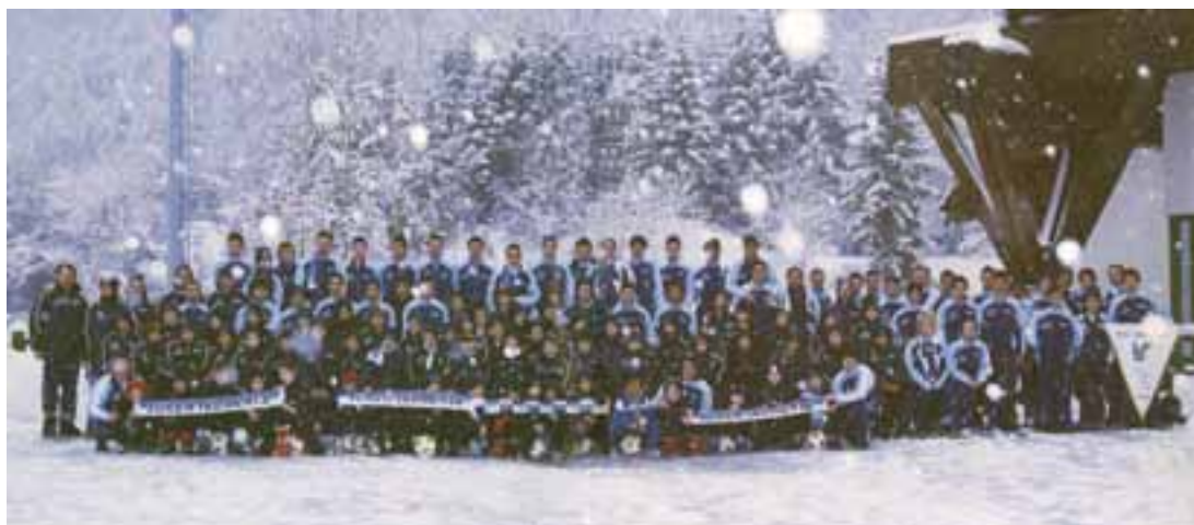
Tutti i numerosi atleti dell'Associazione Calcio Ledrense

una delle più belle epoche del calcio ledrense, la leggendaria squadra femminile, di cui si annuncia una rinascita. Complimenti ai redattori di "Forza Ledrense" e l'augurio a dirigenti e ad atleti di trovare nello sport grandi soddisfazioni.