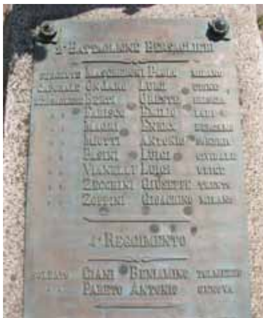
La lapide nel cimitero di Vezza d'Oglio con l'elenco dei caduti garibaldini