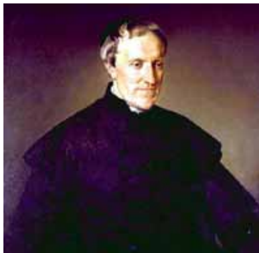
Antonio Rosmini in un ritratto di Francesco Hayez

carità evangelica: sacerdoti, religiose e religiosi, laici, accompagnarono lo sviluppo dell'Italia smorzandone le contraddizioni e colmando le manchevolezze dello Stato (Don Bosco ne fu forse l'esempio più prezioso e grande). La grande