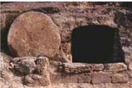
La tomba vuota

escort, veline, grande fratello e diavolo che porta via. Non sappiamo nulla di quelle 40 ragazze di Bologna, morte dal 1930 al 1960 all'ospedale Pizzardi nell'assistere i malati di tubercolosi. Quaranta ragazze fra i 25 e 35 anni che silenziosamente e consapevolmente hanno dato la vita adoperandosi senza riserve per i loro concittadini. E non conosciamo la storia di quei 40 giovani seminaristi del Burundi che durante la guerra fra Hutu e Tutsi, assaliti dai guerriglieri, all'ultimatum di dividersi per etnia, hanno preferito dichiararsi tutti figli di Dio e così essere uccisi. Storie che ci dicono che il Mondo è ancora Bello, perché il seme della Vita, del Bello, della Risurrezione è ancora presente. Sta a noi ogni giorno mantenere viva questa nuova Luce.