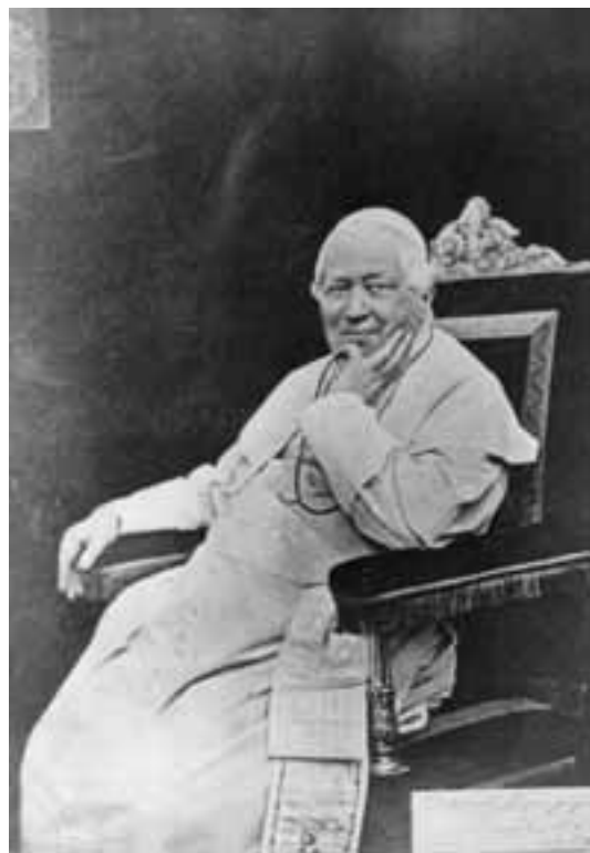
Papa Pio IX

gli Svizzeri conquistando le Marche e l'Umbria, che poi sancirono la loro annessione al Regno d'Italia tramite un plebiscito. Il potere temporale dello Stato della Chiesa rimase di conseguenza ancorato all'ultimo baluardo a Roma, che non venne coinvolta nella campagna del 1860 di Vittorio Emanuele II.